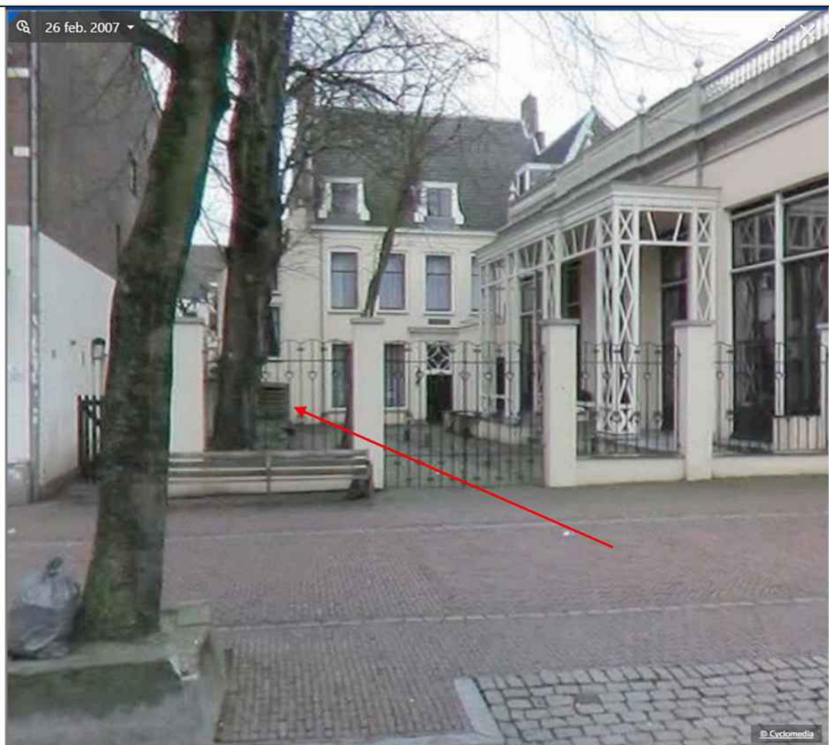
Streetview foto van 2007, is de berging al te zien.