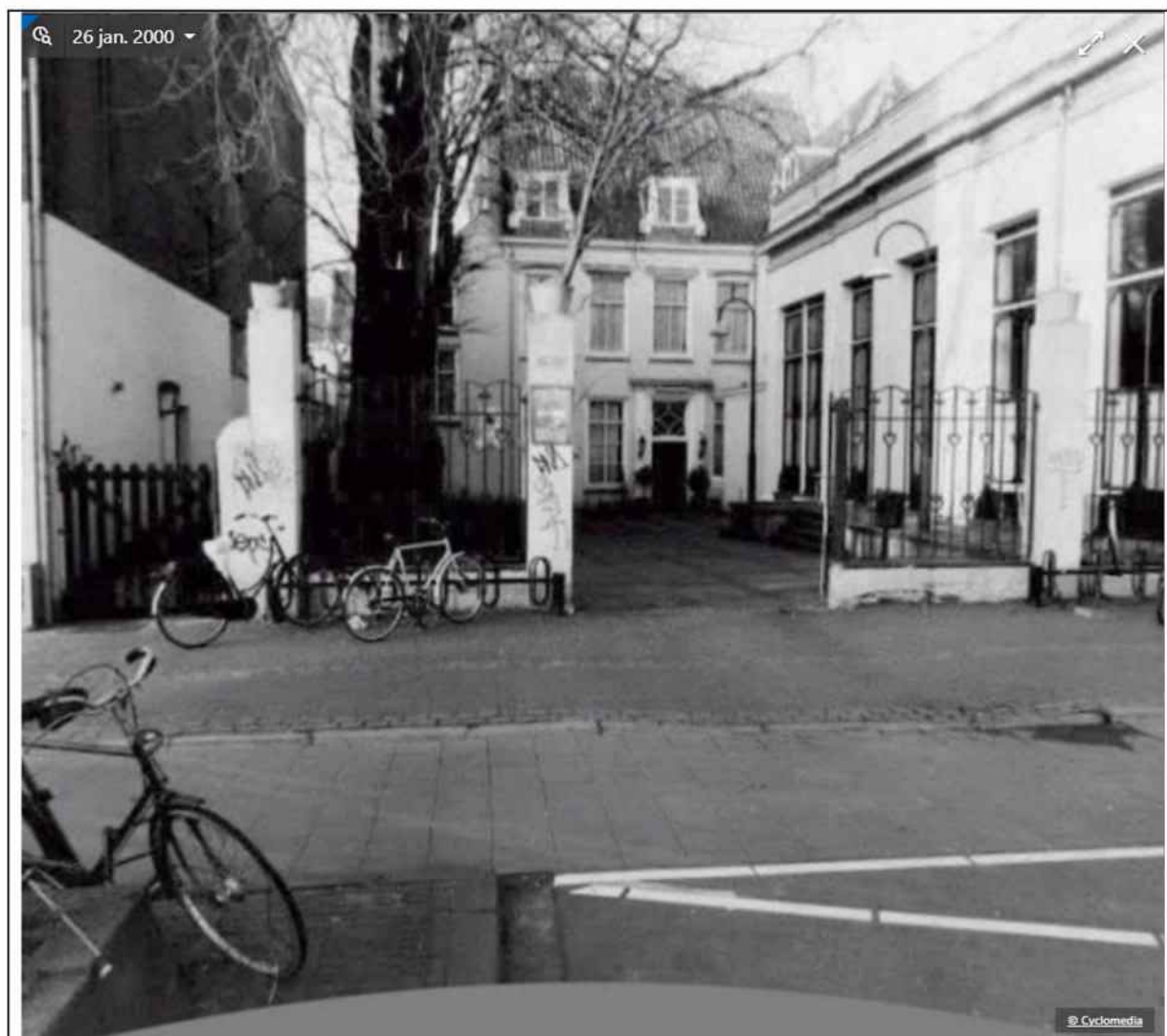
In jaar 2000 geen berging zichtbaar