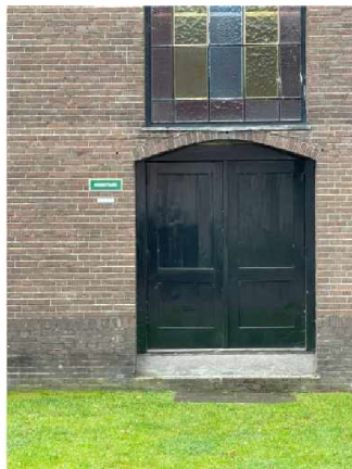
Alternatieve vluchtroute naar aansluitende terrein

De foto geeft een overzicht van het binnenterrein, gezien vanaf de vluchtrap van het studentenhuis. Daar waar het een gedeelte van het pand in de steigers staat (aan de rechter zijde) bevindt zich een route naar het aansluitende terrein. Tevens is er een vluchtmogelijkheid via een deur in het pand op de achtergrond.