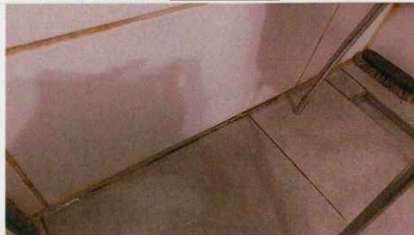
Foto-24 Badkamer, 5.1.2.e