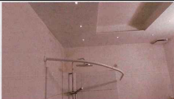
Foto-21 Badkamer, 5.1.2.e