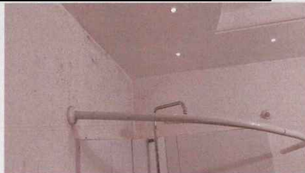
Foto-22 Badkamer, 5.1.2.e